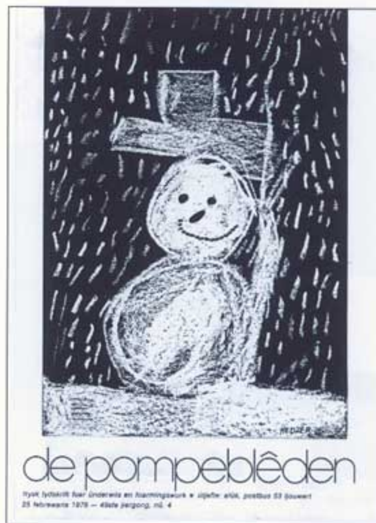
Ein 70'er jierren wurdt De Pompeblêden in algemien Frysk tydskrift foar it hiele ûnderwiis yn Fryslân. It ferskynt op A4 formaat, tweintich kear yn 't jier (1978-1987).

De AFUK is no de útjouwer fan dit hiele nije tydskrift, mar it giet út fan de fiif boppeneamde organisaasjes. Der komt in breder ferskaat fan bydragen; it kriget in grutter formaat en wurdt mei in steunkleur printe. Advertinsjes krije harren plak. It blêd nimt gjin artikels op dy't yn in lanlik