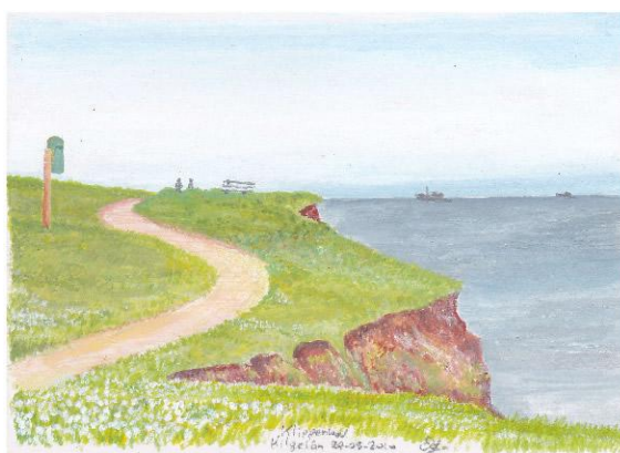
tekening Ed Knotter

Boppesteande útstellen jouwe ek in moaie oanfolling op en fierdere útwurking fan kêst 14 fan it Europeesk Hânfêst dat hannellet oer ‘útwikselings oer de grinzen hinne’. Dat is op it aljemint brocht yn it Oanfalsplan Frysk (2008; einredaksje S.T. Hiemstra) fan de FFU en oaren ( www.fryskebeweging.nl/FFU/aktiviteitenebrieven2010 ). Kêst 14a slacht op it befoarderjen fan de kontakten tusken de brûkers fan ‘deselde’ taal yn ferskillende steaten op it mêd fan kultuer, ûnderwiis, ynformaasje, beropsoplieding en permaninte edukaasje; kêst 14b op it makliker meitsjen en/of befoarderjen fan gearwurking oer de grins hinne tusken regionale of lokale autoriteiten fan gebieten dêr't de minderheidstaal brûkt wurdt.